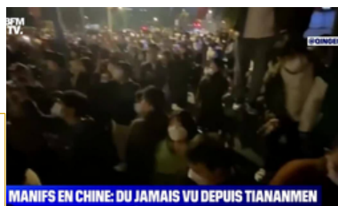
MANIFS EN CHINE: DU JAMAIS VU DEPUIS TIANANMEN