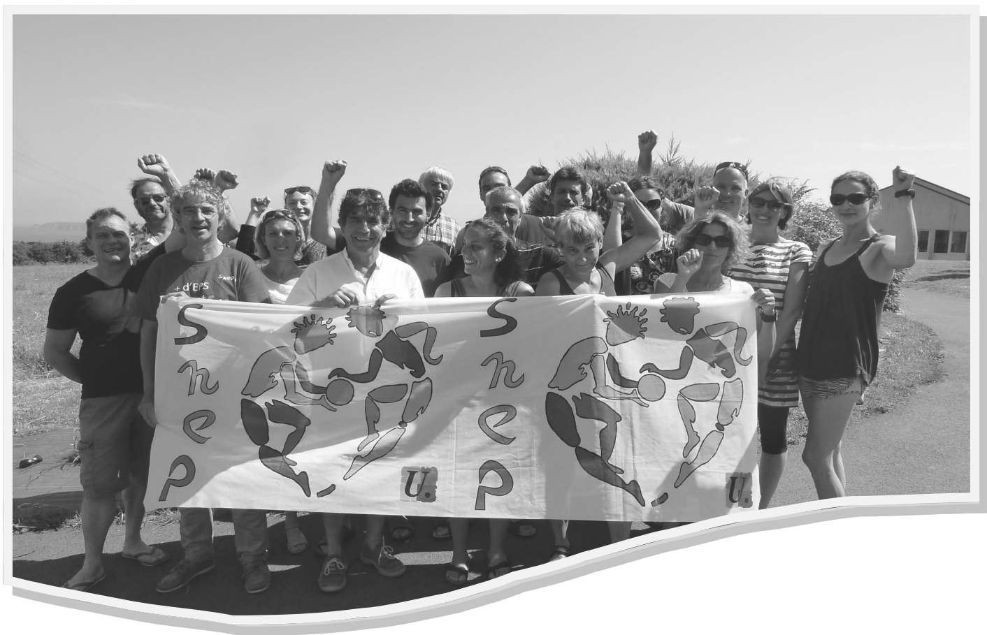
Les militants du SNEP au conseil académique de juin à Pleneuf-Val-andré